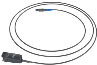
Fingersensor mit Verbindungskabel